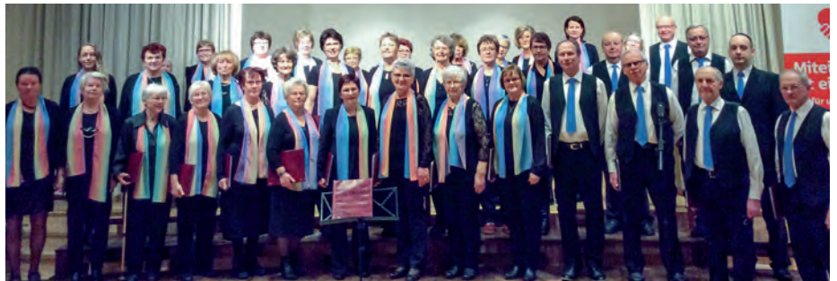
Der Gemischte Chor Pulsnitz 2018.