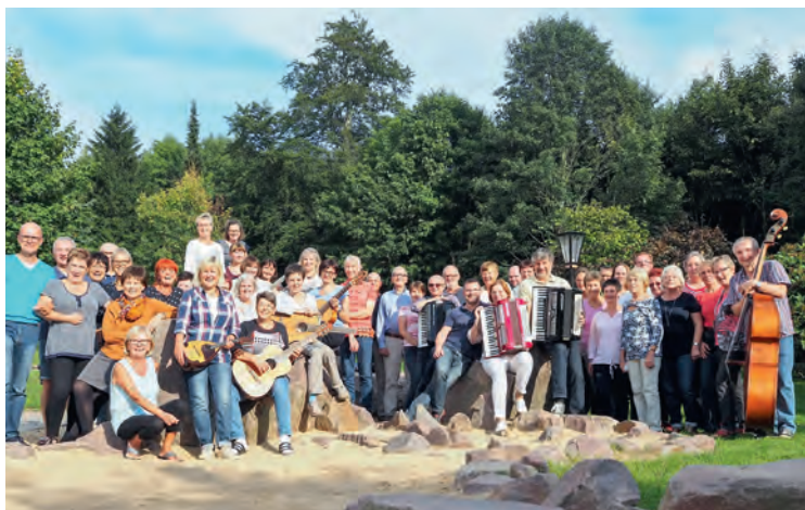
Das Florian-Geyer-Ensemble Chemnitz im jährlichen Probenlager.