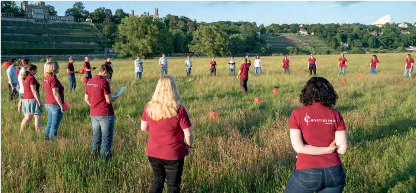
Für ihre erste »analoge« Chorprobe im Freien nach vielen »Digitalwochen« hatte sich Chortissimo Dresden Mitte Juni eine besondere Kulisse herausgesucht: die Elbwiesen in Dresden mit den Elbschlössern.