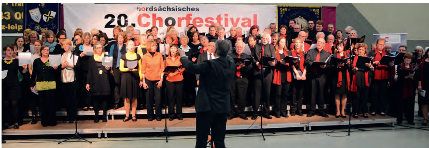
Das Jubiläums-Festival in Nordsachsen 2019.

Über 20 Jahre lädt der Chor Arion Glesien im Frühjahr zu einem Begegnungs-Festival nach Nordsachsen